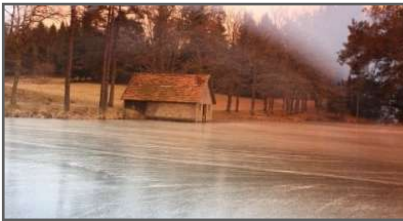
L'Étang de Laborde gelé en 2009