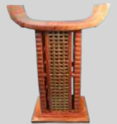
Tabouret du royaume Dahomey, 2006

Cinquante meubles se dévoilent au fil de l'exposition, proposant un panorama des meubles du quotidien domestique, ceux qui ont été offerts en présent diplomatique à l'État français de 1995 à 2007 (coffres), et ceux qui ont habillés les parties publiques ou privées des résidences présidentielles, dont le Palais de l'Élysée entre le XIXe siècle et 2024 (sièges, guéridons, etc.).