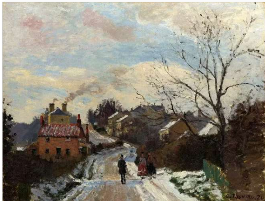
Camille Pissarro, Fox Hill ; Londres, 1870, huile sur toile, 35,3 x 47,5 cm ( Camille Pissarro a vécu à Londres de 1870 à 1872 )

Nous vous souhaitons une très belle Année 2024