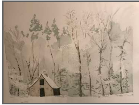
"Château de Beaufort, Le four à Pain en hiver". Aquarelle de Peter Franklin